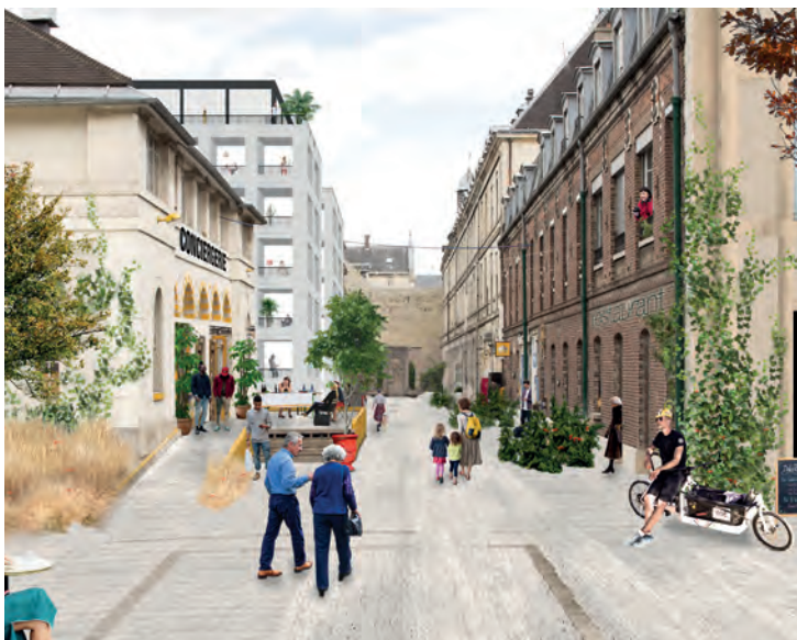
> Ambiance de quartier autour de la Lingerie conservée.