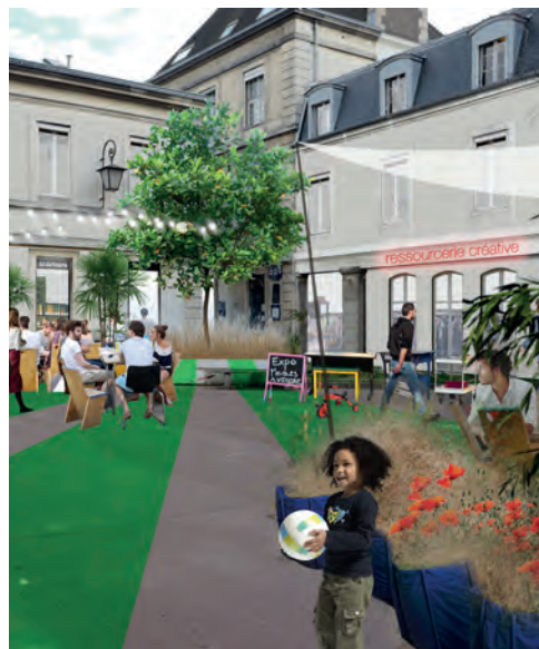
> Des aires de jeux et de loisirs pour tous.