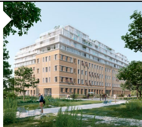
© Lacaton & Vassal / Gaëtan Redelsperger / Bureau jaune

Maîtres d'ouvrage : Quartus (promoteur) / Habitat & Humanisme [investisseur logements sociaux et foncière BRS]