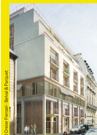
© Dreier-Frenzel - Belval & Parquet

Foncière BRS : Foncière de la Ville de Paris